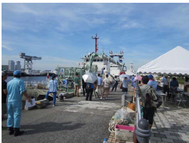
横浜港特別行事（平成27年度実施状況）